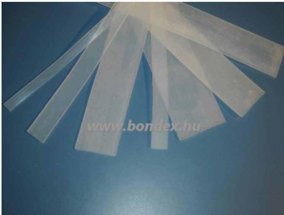
Lapos szilikon alátét hegesztő géphez