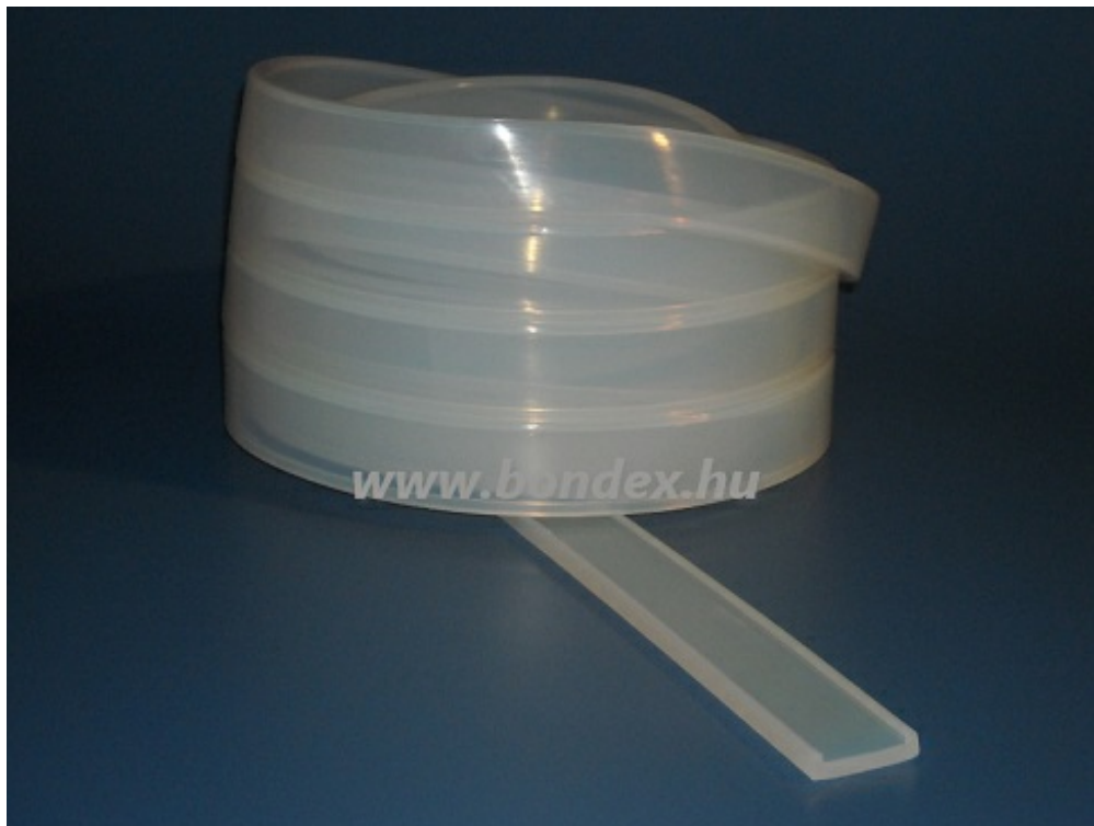
hőálló alátét szalag

Előre egyeztetett méret és műszaki paraméterek alapján, egyedi méretű szilikon T profil termékek gyártását rövid határidővel vállaljuk.