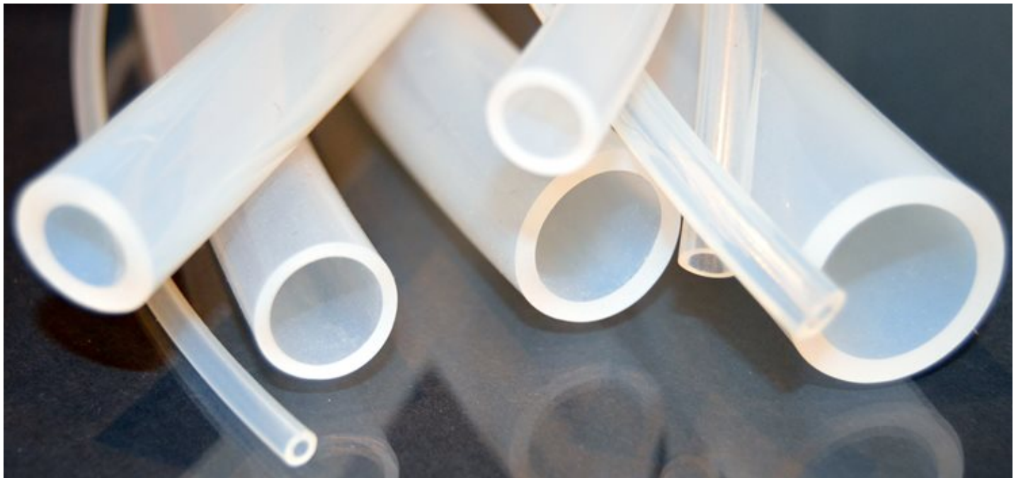
Egészségügyi szilikon csövek