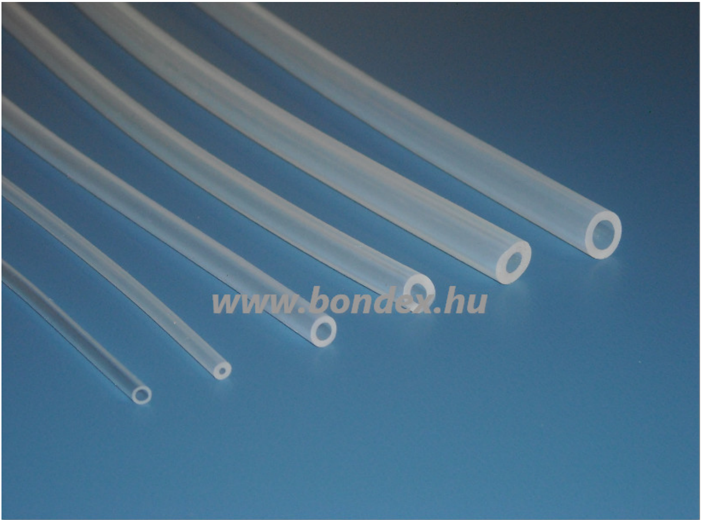
Egészségügyi átvezető szilikon csövek