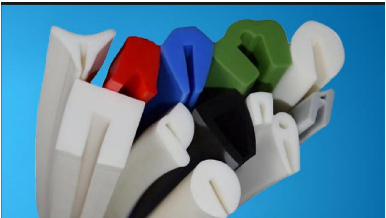
Szilikon élvédő profilok

20 ShA, 30 ShoreA, 40 ShA, 50 Shore A, 60 Shore°A, 70 Sh°A 80 SoreA valamint 90 ShoreA.